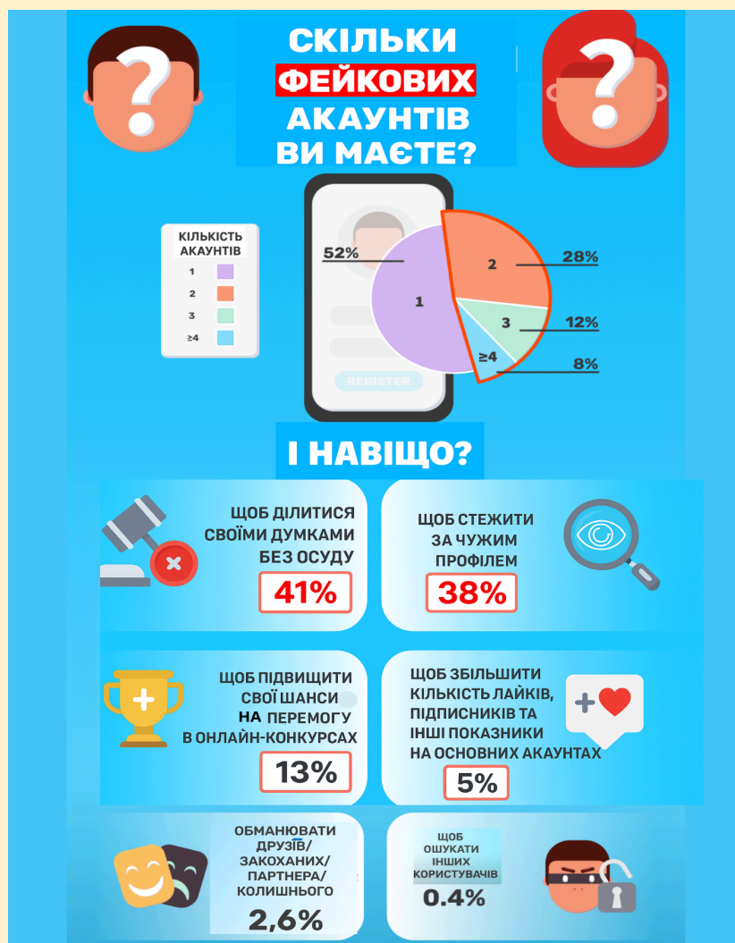
Рисунок 1. Фейкові акаунти. Примітка. Адаптовано за: TechNewsWorld. (2022). Infographic social network how many fake accounts owned [Інфографіка]. https://www.technewsworld.com/wp-content/uploads/sites/3/2022/08/infographic-social-network-how-many-fake-accounts-owned.png

Розгляньте інфографіку про фейкові акаунти. Виконайте завдання 9.