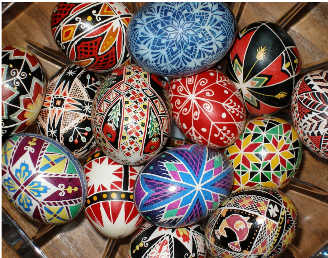
Рисунок 1. Писанки. Примітка. Джерело: Pixabay (2017). Pysanky Easter Eggs Traditional. https://pixabay.com/photos/pysanky-easter-eggs-traditional-1893035/

Наближається свято Великодня, і у школі вирішили організувати виставку «Моя писанка – мій оберіг». На цю подію запрошено учнівство, учительство, батьківство та місцевих майстрів народного мистецтва. Кожен клас має підготувати власну колекцію писанок, яка продемонструє знання українських традицій та здатність створювати нові, сучасні й оригінальні вироби.