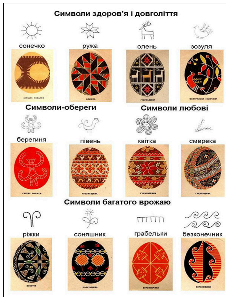
Рисунок 2. Символи. Примітка.