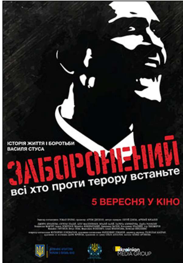
Рисунок 2. 2

Розгляньте афішу до фільму «Заборонений» (реж. Роман Бровко, 2019). Виконайте завдання 17, 18.