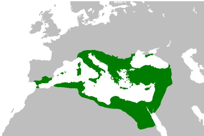
Рис. 8. Карта №2. Примітка. Джерело: [5]