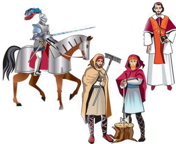
Рис. 9. Представники середньовіччя. Примітка. Джерело: [6]

18.1 Представники яких середньовічних станів зображені на ілюстрації? Чиє зображення варто було б додати?