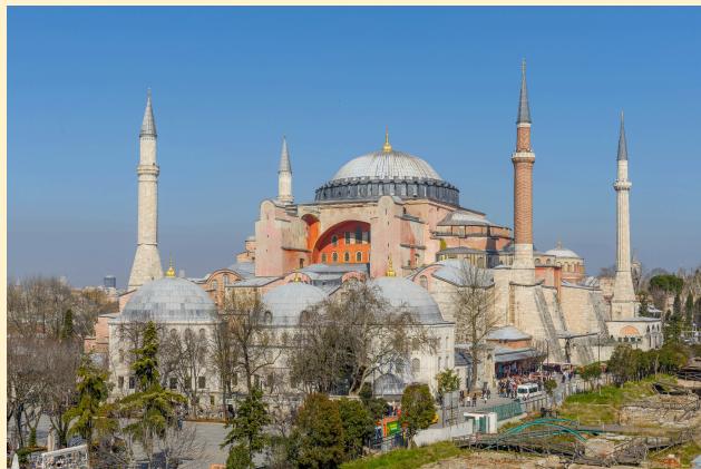
Рис. 7. Софійський собор (Айя-Софія). Примітка. Джерело: [4]

Розгляньте зображення. Дайте відповіді на запитання 14-15: