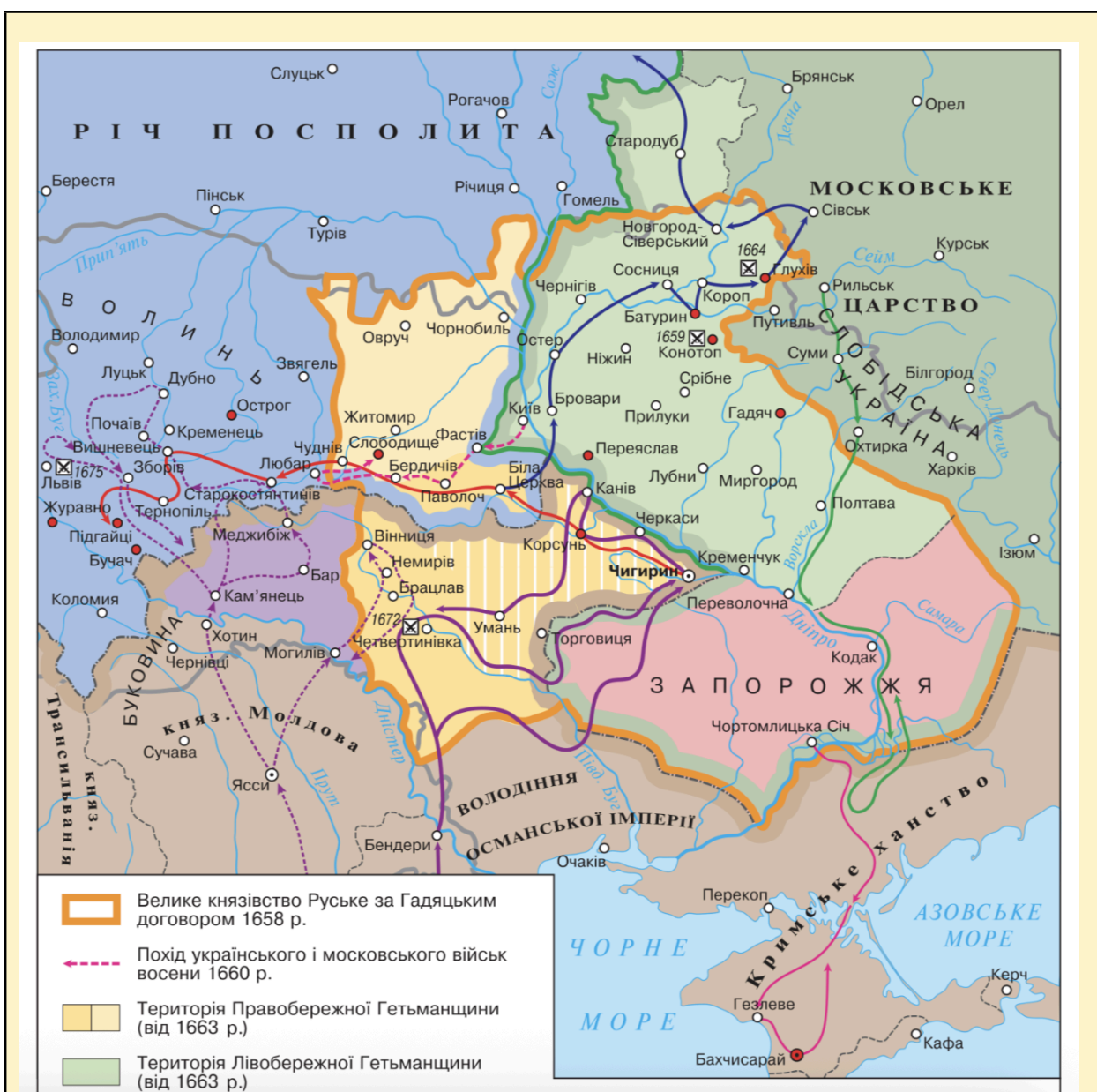
Рис. 3. Зображення Ордену Юди. Примітка. Джерело: [3].