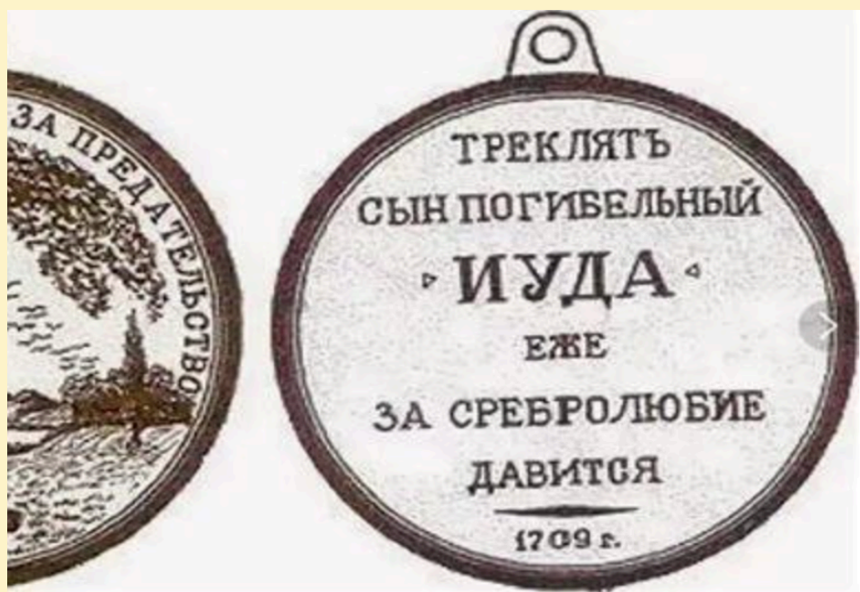
Рис. 2. Зображення Ордена Юди. Примітка. Джерело: [2].

Джерело 2: уривок з указу Петра I про анафему Івану Мазепі (31 жовтня 1708 р.).