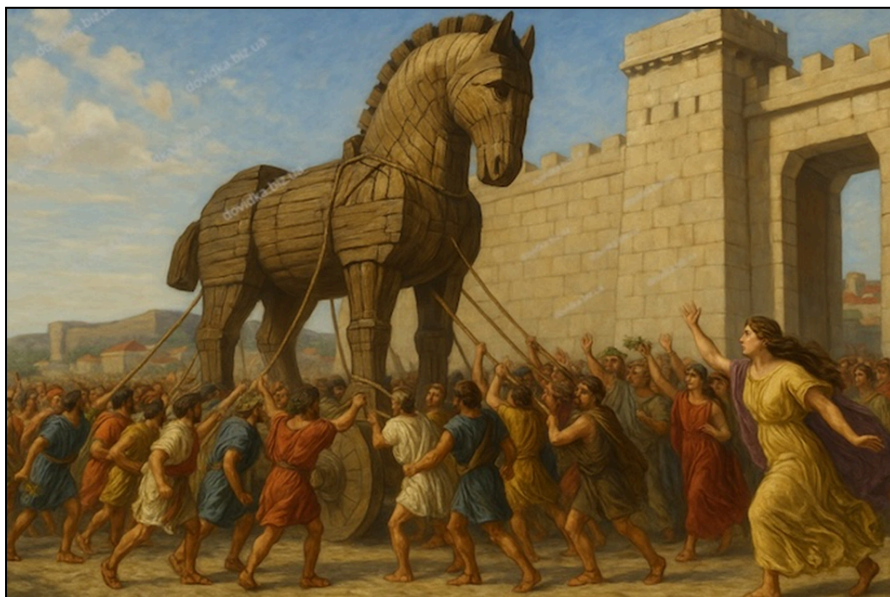
Рисунок 1 1

Розгляньте зображення 1 і 2 та виконайте завдання 1–4.