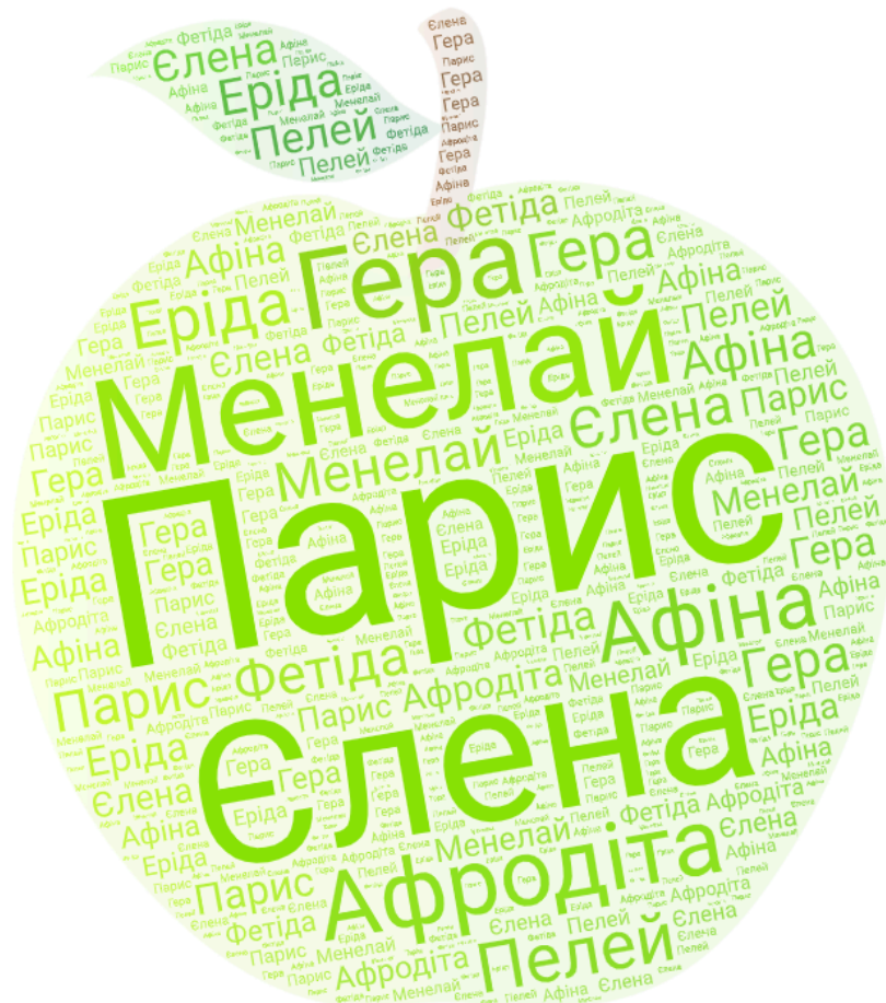
Рисунок 3 3

Уважно розгляньте хмару слів і виконайте завдання 5–11.