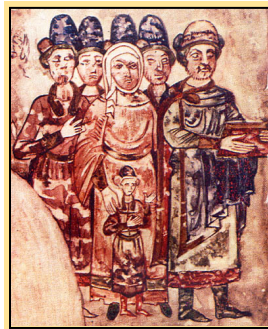
Рис. 4. Портретне зображення. Примітка. Джерело: [4].

9. Розгляньте портретне зображення з «Ізборника» XI ст. Які три тези характеризують правління князя, чий портрет з родиною уміщено в «Ізборнику»?