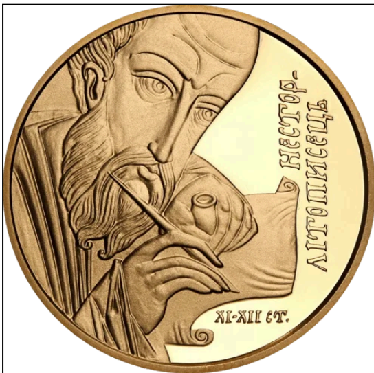
Рис.1. Монета. Примітка. Джерело: [1]. (Повний опис джерела див. у розділі “Методика”).

2. Яка подія відбулася в той самий рік, коли було завершено створення літературної пам’ятки, автор якої зображений на монеті?