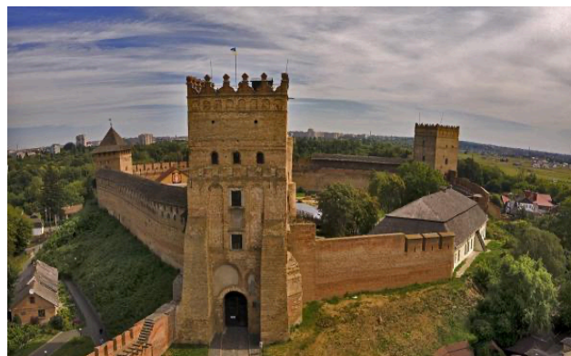
Рис 9 9 . Історична пам'ятка 2.