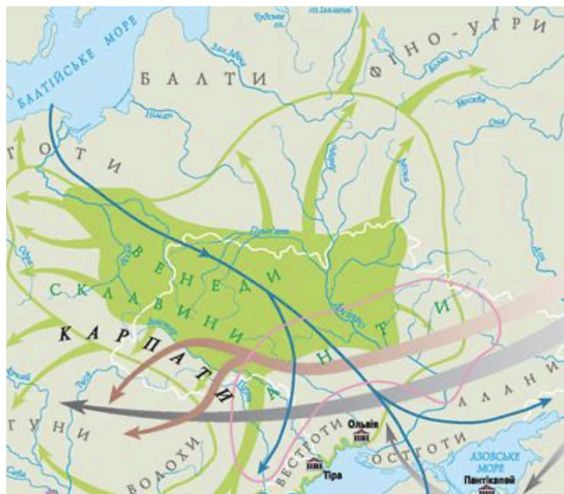
Рис 6 6 . Картосхема.

«Вони не підпорядковані суворій владі царя, а вдовольняються випадковим керівництвом найзнатніших ... У них ніхто не займається хліборобством і ніколи не береться до сохи. Всі вони, не маючи ні певного місця проживання, ні домашнього вогнища, ні законів, ні сталого способу життя, мандрують по різних місцях, наче вічні втікачі... Цей рухливий і відчайдушний народ, палаючи невгомною пристрастю до загарбання чужої власності, посуваючись вперед серед грабежів і бійні сусідніх народів...»