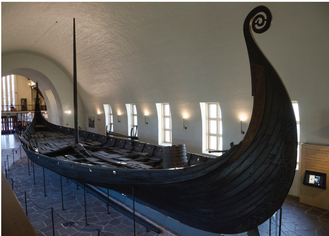
Рис 1 1 . Корабель з Осеберга.

2. До якої історичної культури та періоду належить цей тип судна?