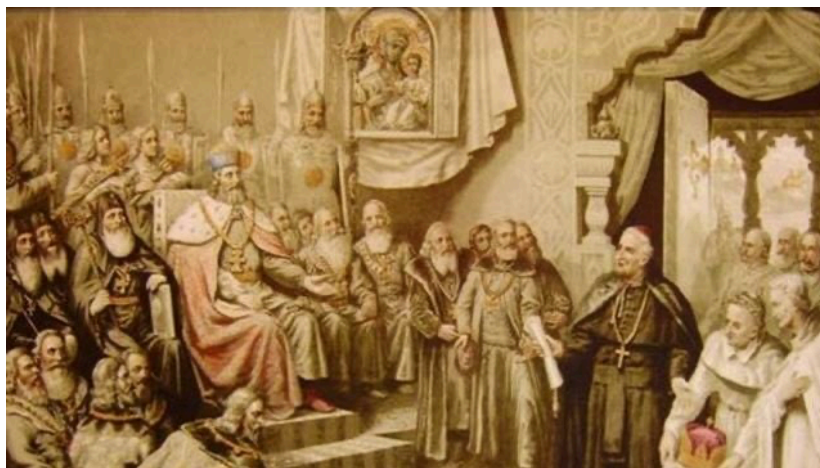
Рис 5 5