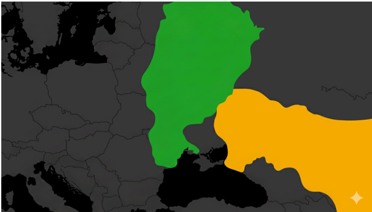
Рис 3 3 . Картосхема “Кордони Русі”

7. Розгляньте картосхему, яка відображає кордони Русі-України у 950 р. Вкажіть, яка держава розташована на південному сході від неї. Відомо, що частина східнослов'янських племен платила данину її правителю.