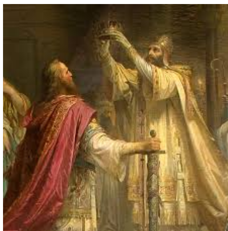
Рис 4. 4 Фрідріх фон Каульбах. "Коронація Карла Великого"

8.1. Сформулюйте підпис, що мав би бути під другим зображенням. Ураховуйте той факт, що сюжет другої ілюстрації змальовує таку ж церемонію, що і робота Ф. Каульбаха. Але події відбувалися в Волинсько-Галицькій державі.