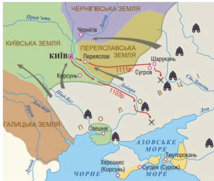
Рис 12 12 . Легенда карти.

14. Проаналізуйте карту, оберіть три твердження, які можуть відображати легенду карти.