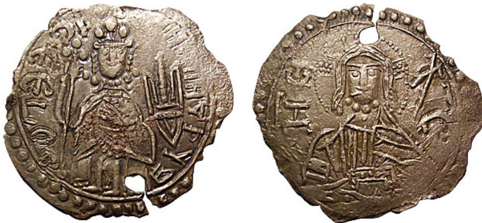
Рис 2 2 . Срібники Володимира Святославича.