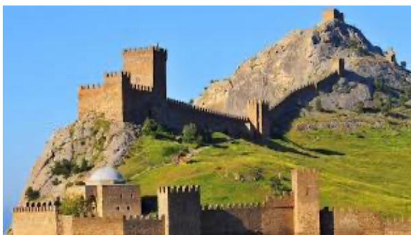
Рис 10 10 . Історична пам'ятка 3.