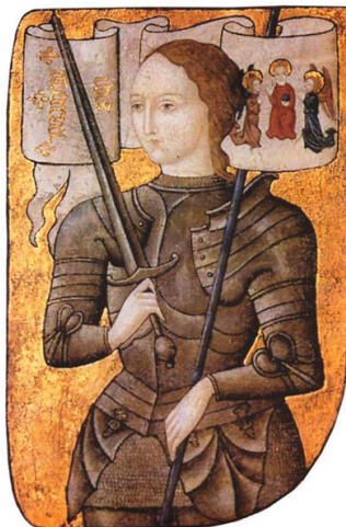
Рис 7 7 . Мініатюра.

Розгляньте мініатюра XV ст., на який зображено Жанну д'Арк