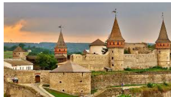
Рис 11 11 . Історична пам'ятка 4.