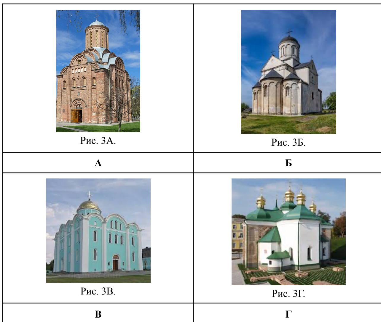
Рис. 3(А-Г). Історичні пам'ятки . Примітка. Джерело: [3].

10. Який з храмів є прикладом поширення впливу романського стилю у волинсько-галицькій архітектурі?