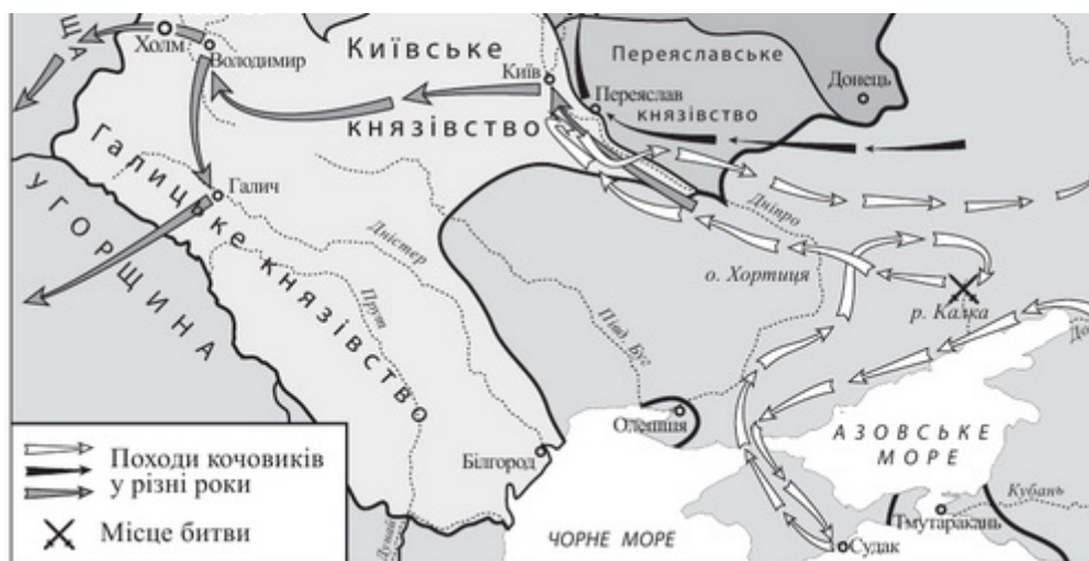
Рис. 1. Карта №1. Примітка. Джерело: [1]. (Повний опис джерела див. у розділі “Методика”).