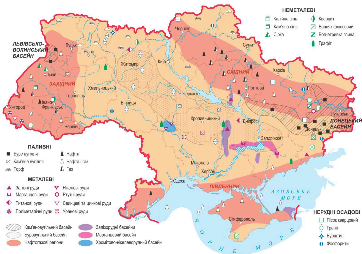
Рис. 6. Промислові родовища мінеральних ресурсів України. Примітка. Джерело: [6].

8. Розгляньте карту мінеральних ресурсів України. Визначте, які твердження є достовірними щодо розміщення та видобутку корисних копалин.