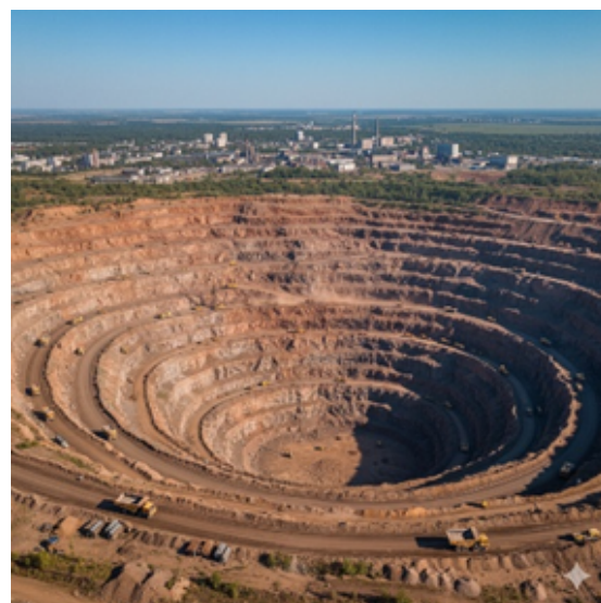
Рис. 8. Залізгорудний кар'єр. Примітка. Джерело: [8].