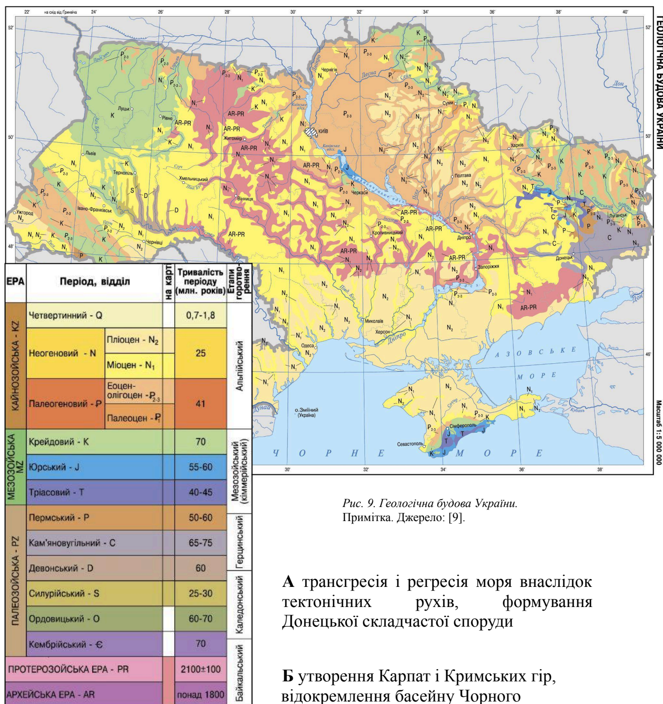
Рис. 9. Геологічна будова України. Примітка.

11. Ваша команда створює анімаційний ролик «Україна за 60 секунд» про її геологічну історію. За геологічною картою визначте й упорядкуйте ключові етапи формування території України від найдавнішої до найновішої.