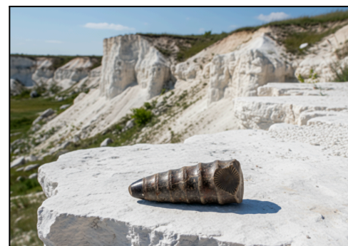
Рис. 3. Крейдяні скелі. Примітка. Джерело: [3].

2. У процесі планування маршруту крейдяними схилами Донеччини ваша команда знайшла скам'янілість, схожу на наконечник стріли (див. фото). Місцеві називають її «громовою стрілою» бога Перуна, яку він кидав на землю під час грози. Однак геологічний довідник дає інше пояснення. Наведіть наукове тлумачення знахідки.