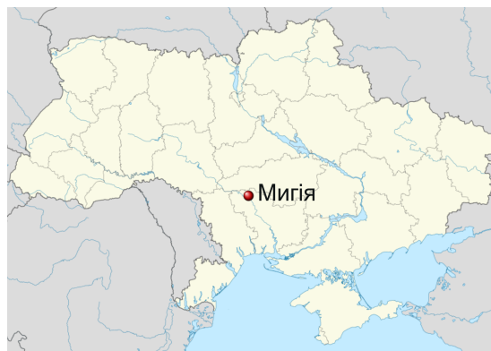
Рис. 7. Мигія - туристичний центр рафтингу. Примітка. Джерело: [7].