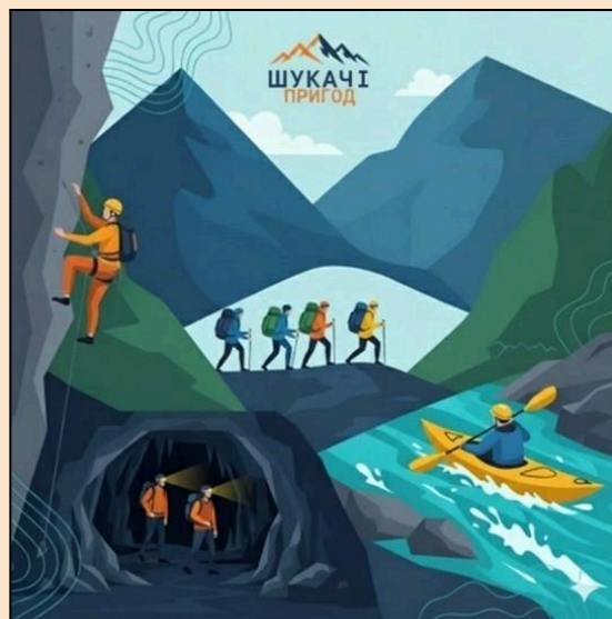
Рис. 1. Шукачі пригод. Примітка. Джерело: [1]. (Повний опис джерела див. у розділі “Методика”).

Щоб ваші маршрути були не лише цікавими, а й безпечними, а розповіді — змістовними, необхідно ґрунтовно вивчити геологічну будову, тектоніку, рельєф і мінеральні ресурси тих територій.