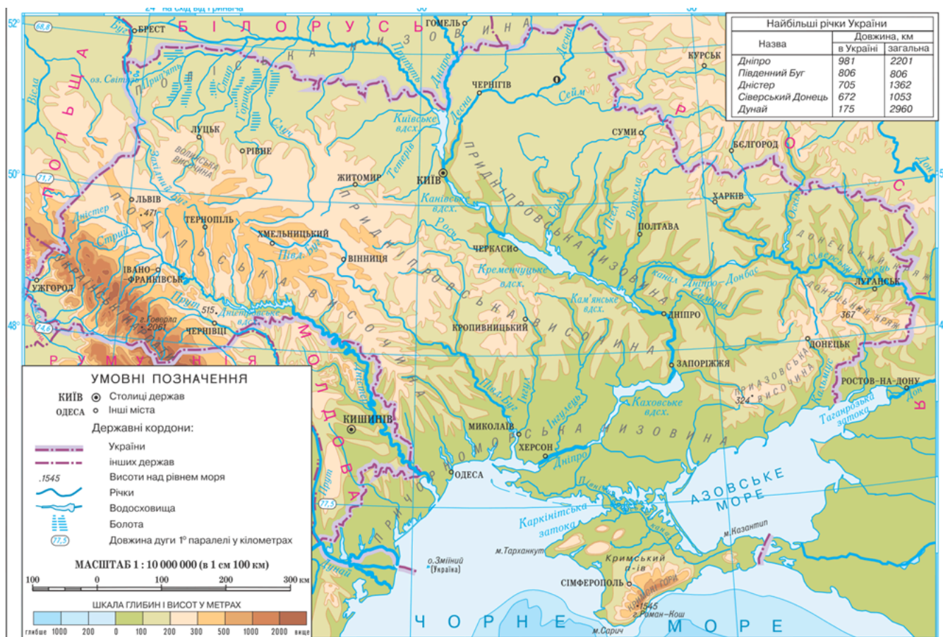
Рис. 5. Фізична карта України. Примітка. Джерело: [5].

5. У відеогідах Україна здається суцільною рівниною. Насправді ж її поверхня сформована різними тектонічними структурами. Проаналізуйте фізичну карту й визначте, які форми земної поверхні відповідають кожній тектонічній структурі. (Для виконання завдання скористайтесь картою в завданні 1.)