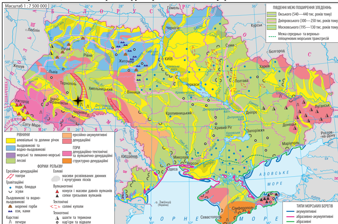
Рис. 4. Геоморфологічна будова України. Примітка. Джерело: [4].

3. Ваша команда планує експедицію до найдовшої у світі гіпсової печери Оптимістична на Тернопільщині. Оцініть її розташування на геоморфологічній карті України й укажіть, який тип рельєфу переважає в цьому регіоні.