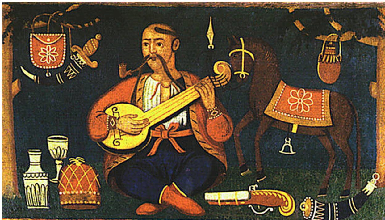
Рисунок 1. Козак Мамай. Народна картина Олія. 18 ст. Примітка. Джерело: Вікіпедія (б. д.). Mamay.JPG . https://w.wiki/D73m

Розгляньте уважно українську народну картину «Козак Мамай», наведену нижче, і виконайте завдання блоків I -V.