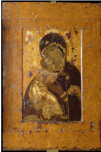
Рисунок 1. Вишгородська ікона Божої Матері. Примітка. Джерело: Невідомий автор (XII ст.). https://commons.wikimedia.org/wiki/File:Vladimirskaia_ikona_Bo%C5%BEiej_Materi.jpg

3. Установіть відповідність між характеристикою ікони «Вишгородська Божа Матір» та її значенням.