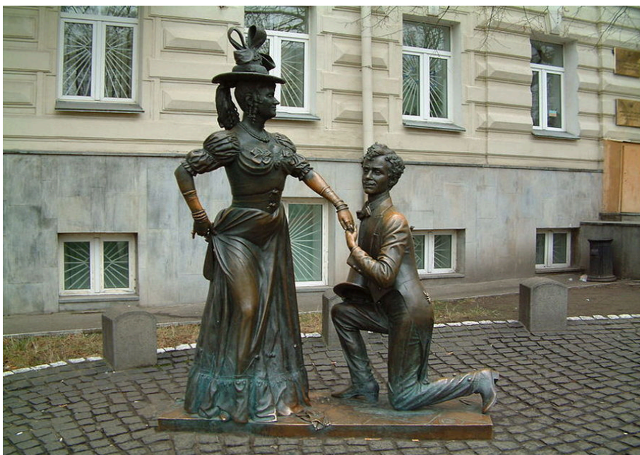
Рисунок 1. За двома зайцями (п'єса) . Примітка. Джерело: Вікіпедія. (б. д.). https://w.wiki/G5RG

Розгляньте зображення 1 і 2 й виконайте завдання 1–4.