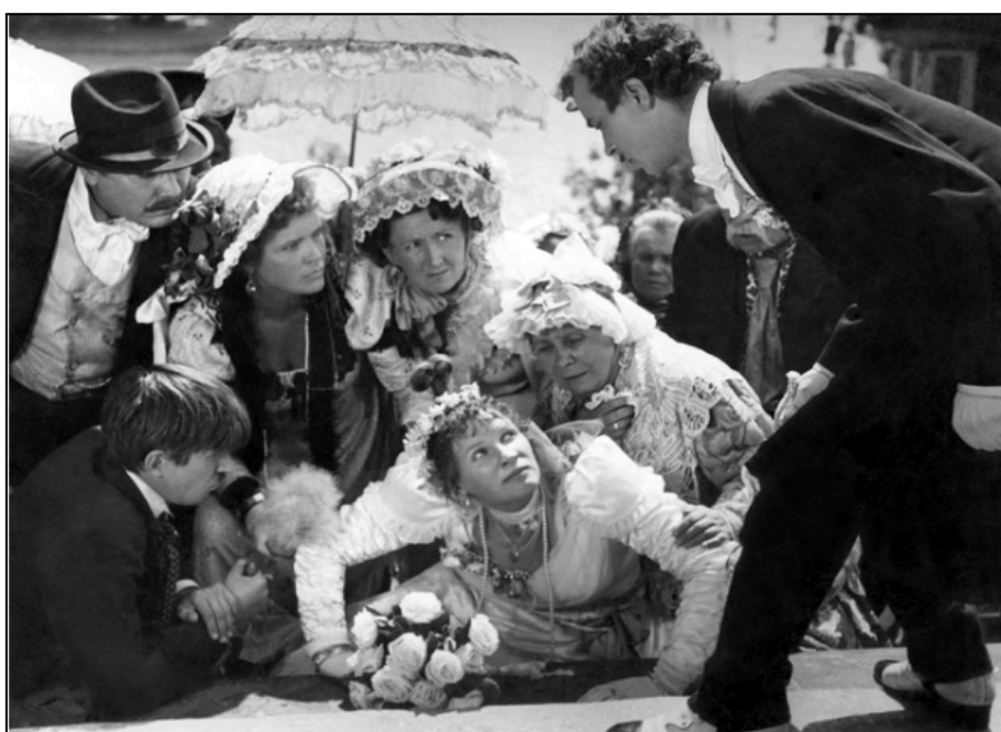
Рисунок 2. За двома зайцями . Примітка.