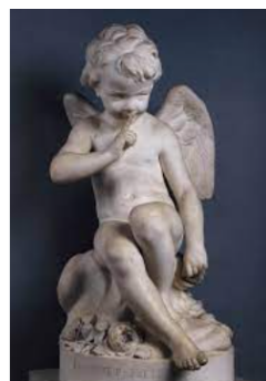
Б Рисунок 2. Амур погрожує 2