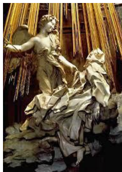
А Рисунок 1. Екстаз святої Терези 1