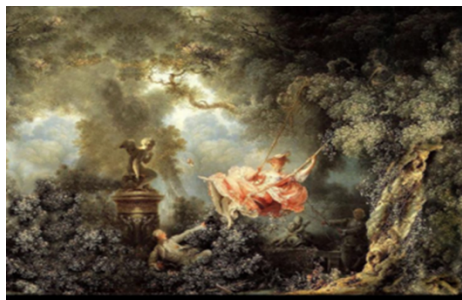
Рисунок 8 8 . Жан Оноре Фрагонар «Гойдалки».

8. Чи можна стверджувати, що витончений стиль рококо називали «дамським стилем»? Поясніть свій вибір, посилаючись на запропоновані твори живопису.