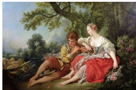
Рисунок 9 9 . Франсуа Буше «Пастух, що грає на сопілці пастушці»