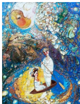
Рисунок 4 4 . Липнева ніч